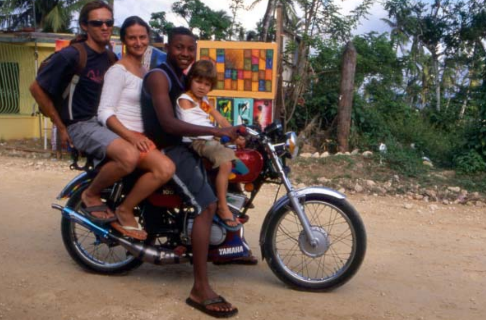
Ci-dessus : Famille sur un taxi concho.