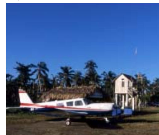
Aéroport El Portillo

petits taxis locaux bien pratiques. Il n'est pas rare de voir des familles entières de dominicains à califourchon sur ces petits bolides.